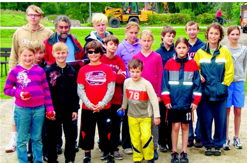
Gruppenfoto mit allen Teilnehmern.

Beim Boccia im Dingolfinger Ferienprogramm