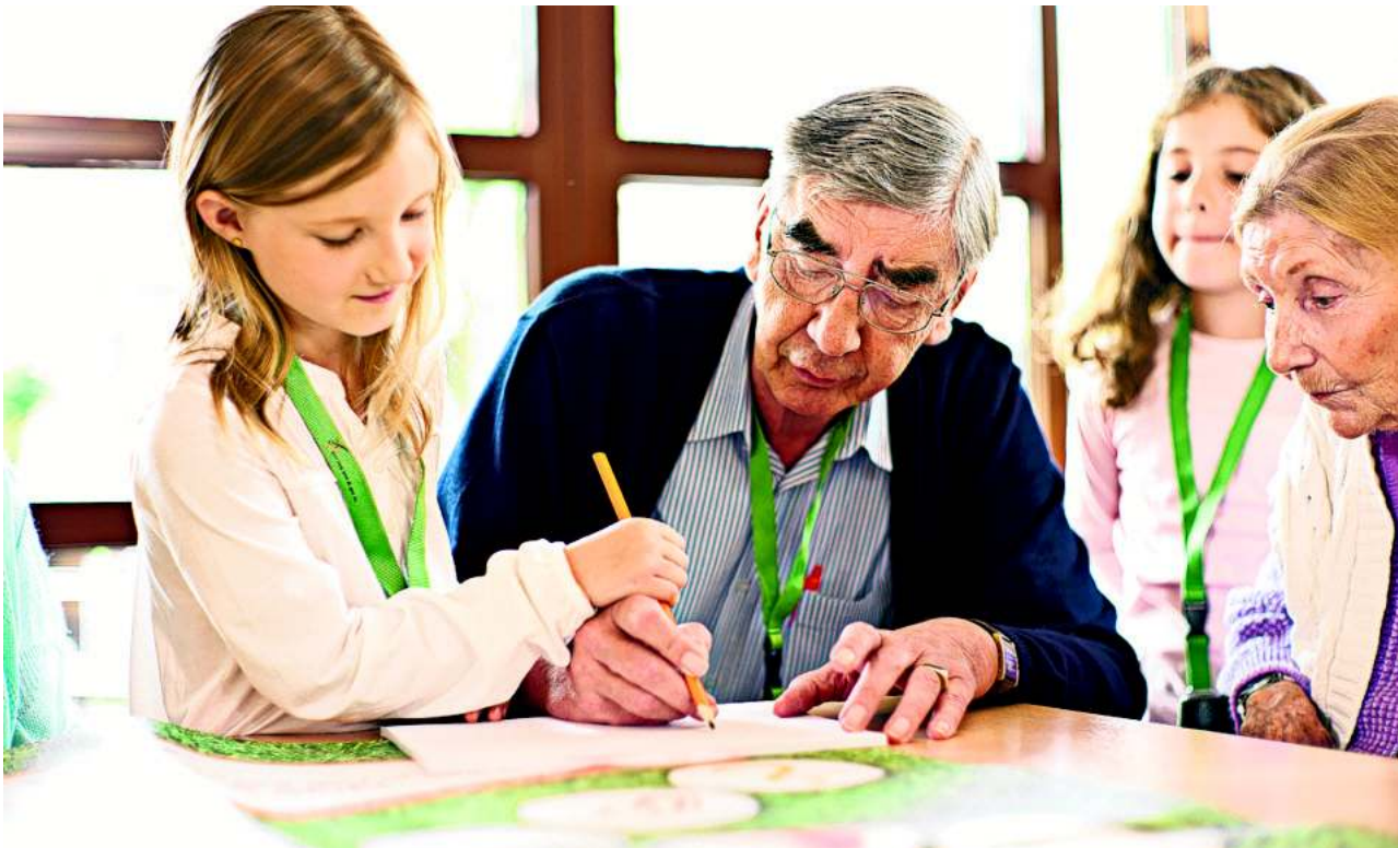
Alt und Jung sollen miteinander ins Gespräch und ins Spiel kommen.

Mitmachen ist ganz einfach. Alle Partner tun, was sie gut können und was ihnen Spaß macht. Mit alten Menschen Musik machen, Videoclips drehen, Theater spielen oder tanzen, alten Menschen vorlesen