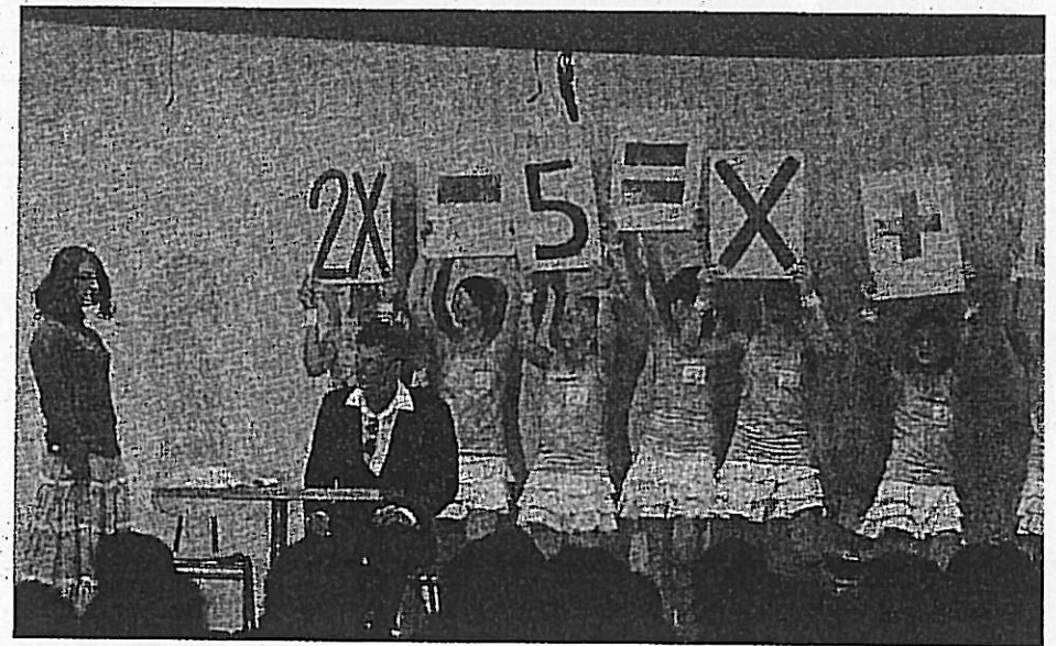
Zu sehen ist die Musicalaufführung im Parkwohnstift durch Schüler/innen der Staatl